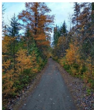
Ancienne piste cyclable, Automne 2025

L'étude examine aussi un enjeu important dans la région: le partage sécuritaire des sentiers avec les usages motorisés (motoneige, VTT), en collaboration avec des spécialistes comme Vélo-Québec.